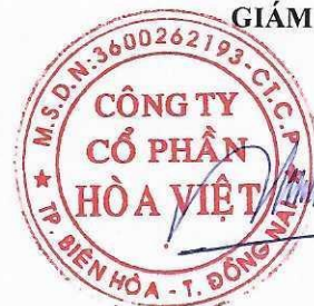
Lương Hữu Hưng