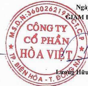
Hồ Quốc Đạt