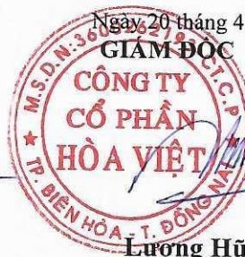
Lương Hữu Hưng