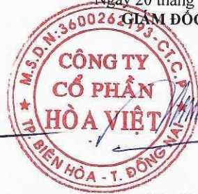
Lương Hữu Hưng