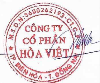
Lương Hữu Hưng