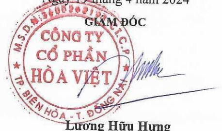
Lương Hữu Hưng