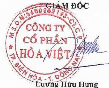
Lương Hữu Hưng