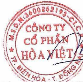
LƯƠNG HỮU HƯNG